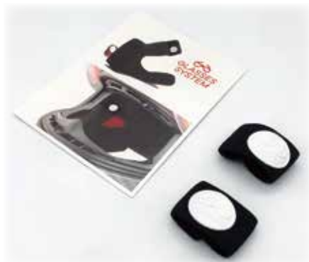
同梱品「グラッシーズシステム」

本製品は同封の「グラッシーズシステム」というゴムバンドによりチークパッド上部を圧縮しメガネをかけ易くする仕様となります。チークパッドを外し、下の写真の様に装着してください。