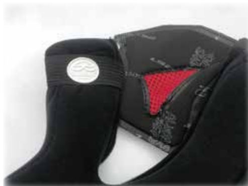
装着例（バンドを掛ける位置はお好みで調整してください）

またチークパッドの裏側上部からクッションスポンジを引き出してカットする加工も可能です。引き出す際スポンジが破けない様、慎重に行ってください。加工に関してはお客様の責務となりますので予めご了承くださいませ。